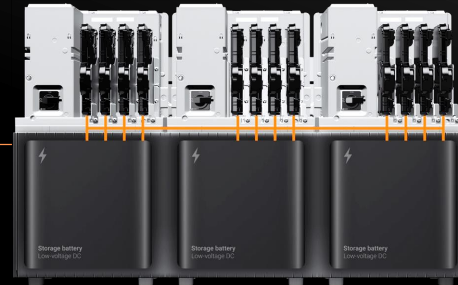
Unsere 10T™ Speicherlösung