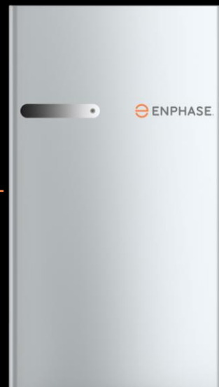
Unsere 3T™ Speicherlösung